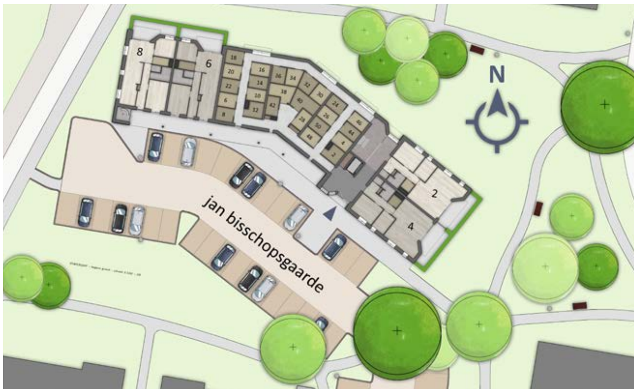
Situatietekening begane grond