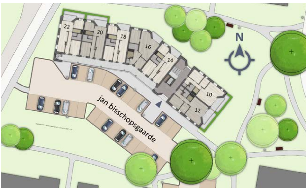
Situatietekening eerste verdieping