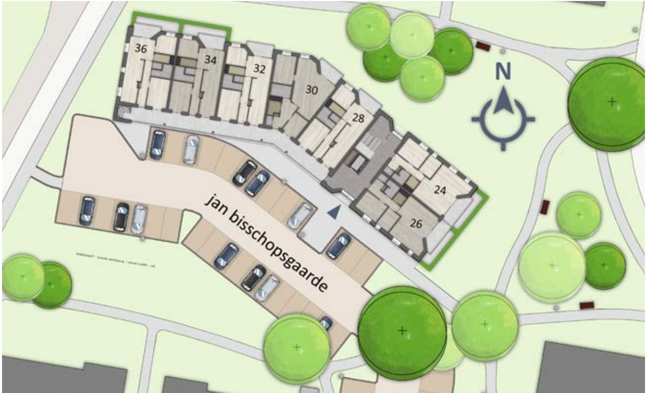
Situatietekening tweede verdieping